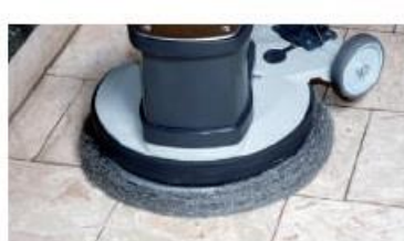
Crystallization of marble floors