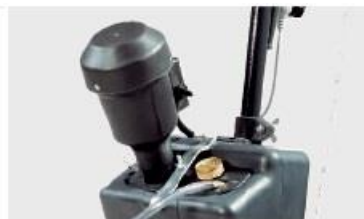
Carpet shampoo device