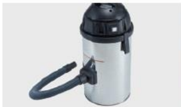
Dust control SDC 120 (optional)