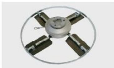
Frowning with the wing float